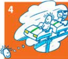
4 Als de aanvraag is goedgekeurd, zorgen wij voor betaling: uw kind kan meedoen!

Het streven is om alle samenwerkende gemeenten (6) via Stichting Leergeld West-Brabant Oost in de loop van 2019 aan te laten sluiten op het portaal Kindpakket.nl