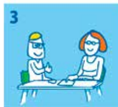
3 Een vrijwilliger van Kindpakket.nl komt bij u thuis om de aanvraag door te nemen