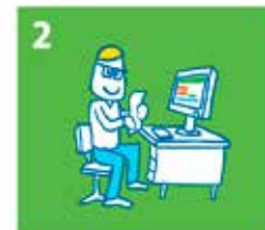
2 Kindpakket.nl behandelt de aanvraag