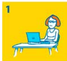
1 Via Kindpakket.nl vraagt u een vergoeding aan