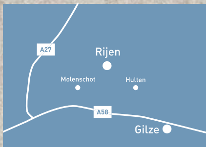
GEMEENTE GILZE RIJEN