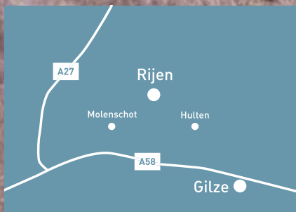
GEMEENTE GILZE RIJEN